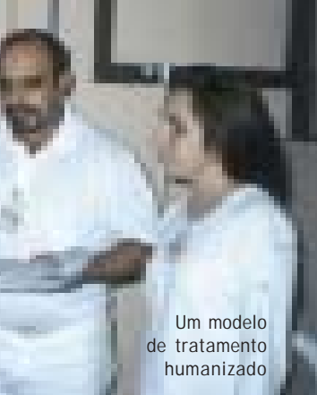
Um modelo de tratamento humanizado

de qualidade dos serviços, realizada sempre que houver atendimento. Tudo isso com o intuito de agradar o paciente, facilitando sua plena recuperação. Prestamos serviço médico-hospitalar a diversos convênios, porém a grande demanda é o convênio SUS, que atinge mais de 60% dos atendimentos.